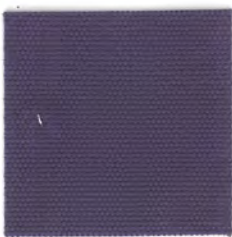
EC32 purple 透光率 1%未満 パープル Mansel value(マンセル値) (H)3.81P(V)3.23(C)3.28