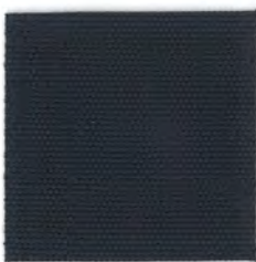
EC30 indigo 透光率 1%未満 インディゴ Mansel value(マンセル値) (H)9.83PB(V)2.14(C)1.73