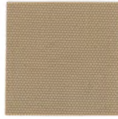
EC14 cafe au lait 透光率 3% カフェ・オ・レ Mansel value(マンセル値) (H)9.30YR(V)5.82(C)2.29