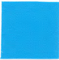
EC31 sax blue 透光率 3% サククスブルー Mansel value(マンセル値) (H)9.88B(V)5.86(C)7.91