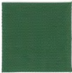
EC33 moss green 透光率 1%未満 モスグリーン Mansel value(マンセル値) (H)1.03G(V)3.84(C)3.29