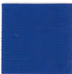
EC26 royal blue 透光率 1%未満 ロイヤルブルー Mansel value(マンセル値) (H)6.91PB(V)3.00(C)7.82