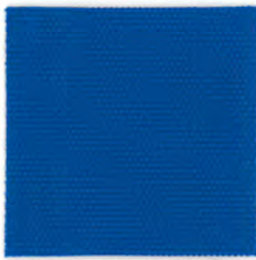
EC25 arabian blue 透光率 1%未満 アラビアンブルー Mansel value(マンセル値) (H)3.52PB(V)3.22(C)8.78