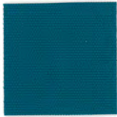
EC24 teal green 透光率 1%未満 ティールグリーン Mansel value(マンセル値) (H)0.78B(V)3.35(C)6.12