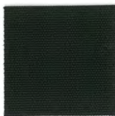
EC29 black 透光率 1%未満 ブラック Mansel value(マンセル値) (H)9.23PB(V)1.63(C)0.07