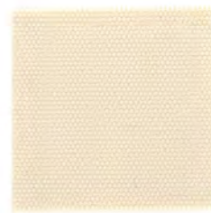
EC12 grege 透光率 20% グレージュ Mansel value(マンセル値) (H)9.69YR(V)7.99(C)2.06