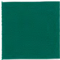
EC23 billiard green 透光率 1%未満 ビリヤードグリーン Mansel value(マンセル値) (H)1.67BG(V)3.77(C)8.14