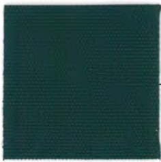
EC22 forest green 透光率 1%未満 フォレストグリーン Mansel value(マンセル値) (H)6.75BG(V)2.52(C)2.65